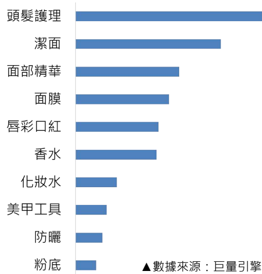
2021中國男性社群用戶關注美妝品類TOP10

市場也關注到這個不容忽視的趨勢，像是KIEHL'S契爾氏和Biotherm碧兒泉等國際知名專櫃保養品品牌，不只有專為男性設計的護膚產品系列，他們在櫃上也提供美容相關問題洽詢的服務，讓男性消費者可以更加自在地購買這些產品。據中國數據平台巨量引擎在2021年針對男性社群用戶調查（右圖），發現男性關注美容護膚品類前三類為 頭髮護理 、 潔面產品 及 面部精華產品 ，顯示出男性在這些領域的重視度極高。市場開始針對男性肌膚需求去開發美容護膚產品，與女性細分類保養品類逐漸相似，因此嘉誠透過這期月刊，帶領大家一同了解現今男性美容護膚趨勢，並提供男性美容護膚品的解決方案，做好萬全準備，迎接男顏經濟的一大商機。