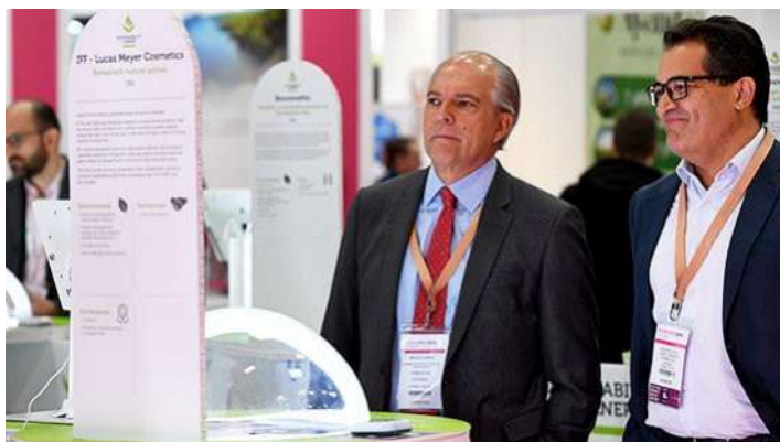
▲原料展探索新知區-永續專區

近年環保意識抬頭，廠商和消費者更加重視綠色產業的市場，而 歐洲戰事 加速 綠色能源轉型 。本次 2022 歐洲原料展將在探索新知區中，特別規劃 永續專區 來做為共同研討，並規劃一系列 綠色原料 的主題，提供給參與者在未來有更多的配方參考方向。這次的永續專區講座中，有一場