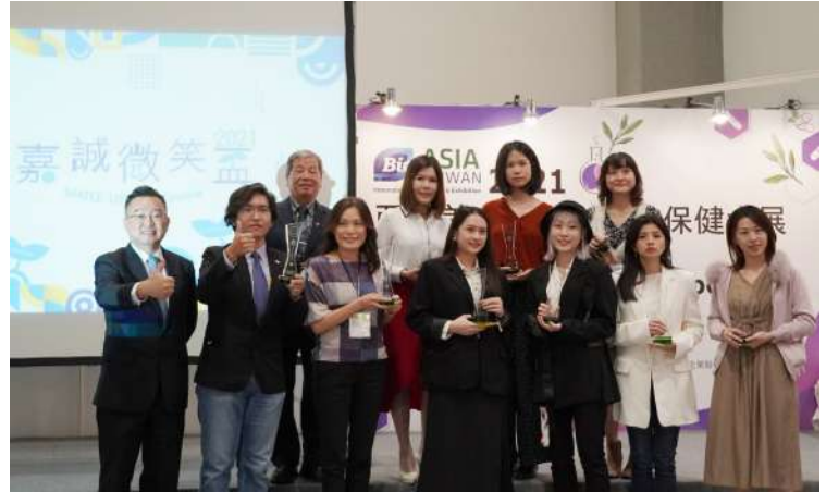
▲ 2021 嘉誠微笑盃X亞洲美容保養生技保健大展 - Taiwan Top 10

【SMILE UP】嘉誠微笑盃 是以「 永續原料 Sustainable Materials 」、「 創新實驗室 Innovative Laboratories 」和「 環境友善化粧品 Eco-Cosme 」的核心理念，建構化粧品產業的 S.M.I.L.E 微笑元素，亦呼應本次歐洲原料展的 永續性主題 ，集結具有產、官、學、研等化粧品各領域的專業人士，舉辦優質的台灣美妝產品評選及配方設計競賽。