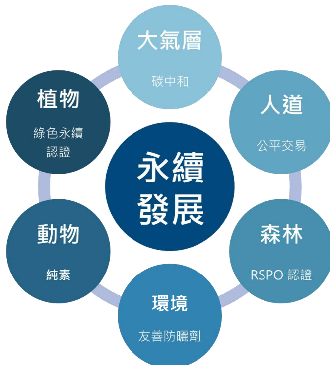
▲（圖二）嘉誠原料永續發展概念圖

綠色環保相關的議題這幾年一直備受關注，而嘉誠所代理的原料商也符合綠色環保理念，像是瑞士活性化粧品原料專家 RAHN（可參考嘉誠月刊第 131 期「 COP26 聯合國氣候峰會 」專題），提供可持續性的原料，供應給具有綠色理念的企業，以減少化粧品產業對地球造成的負擔。以下為嘉誠永續性原料的推薦（請見下頁），結合 大氣層 （碳中和）、 人道 （公平交易）、 森林 （RSPO 認證）、 環境 （友善防曬劑）、 動物 （純素）和 植物 （綠色永續認證），最終達到永續發展的目標（圖二）。若想要了解相關原料資訊，歡迎與嘉誠業務進行聯絡。