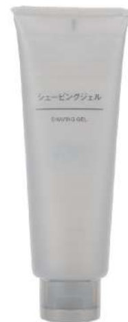
▲ (圖二) 【MUJI 無印良品】 刮毛凝膠

台灣天氣濕熱容易出汗，若是私密處清潔不當或毛髮較為茂盛，容易造成私密處產生異味，甚至成為細菌生長的溫床。私密處除毛可以預防異味的產生及感染，不論是使用哪種除毛方法，最重要的是需要注意私密處除毛會使肌膚的表皮受損，變得乾燥敏感，需要加強私密肌的保濕修復及 鎮靜舒緩 ，日本品牌 MUJI 無印良品推出的刮毛凝膠 (請見右圖，圖二)，此款凝膠添加 5 種保濕成分 (蘆薈汁液、檸檬果皮精華、康福利草精華、啤酒花精華、水溶性蛋白聚醣)，能有效減少除毛時對肌膚的傷害，呵護敏感私密肌。