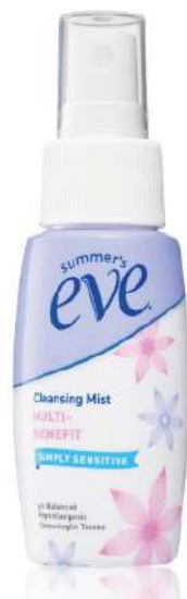
▲（圖三）【Summer' s Eve 舒摩兒】 護理噴劑

私密處的肌膚防護膜較為脆弱，據調查發現私密部位的吸收度是其它皮膚部位的 13-22 倍，因此選擇專為女性私密處設計的護理品牌更為重要，像是歐洲私密保養品牌 SAUGELLA 賽吉兒，專為不同年齡女性設計私密處護理套組，如推出先潔淨再修復的日用型套組（請見右圖，圖四），使用添加天然乳酸及鼠尾草等植物萃取的菁萃潔浴凝露做好基礎清潔，舒緩淨味同時 維持私密肌健康 ，再進一步使用高效修護保濕凝膠，此凝膠劑型清爽保濕，並添加豐富的玻尿酸及義大利蠟菊等植物萃取成分，能 改善私密肌膚暗沉 困擾，達到肌膚滋養與提亮嫩白雙重功效。