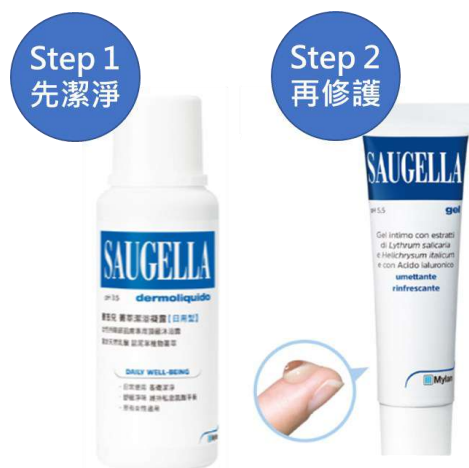
▲（圖四）【SAUGELLA 賽吉兒】 菁萃潔浴凝露-日用型（左） 高效修護保溼凝膠-日用型（右）