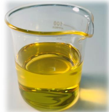
▲ Makattao Varu 金蕊白椿油