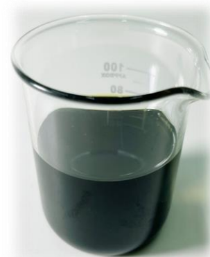
▲ Makattao Madru 瑪杜奇蹟油