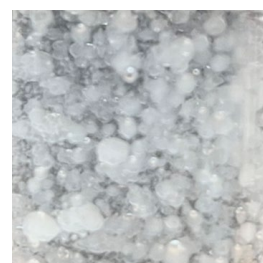
▲ 雪花般的劑型特色

米糠精粹含有 抗氧化維生素E 、 穀維素 及 維生素B1 ，是款具有極高熱穩定及光穩定的活性油脂，兼具優異的抗氧化能力，除了一般化粧品應用，也適合應用在 熱製 的彩妝品。而油膏狀的米糠精粹添加於化妝水配方中，可呈現出 雪花般 的特色。米糠精粹能在化粧品保養品上進行多重劑型變化，達到 應用面最大化 （保養品、彩妝、髮品）的效果。